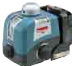
Utilisation en intérieur

Utilisable en positions horizontale et verticale, avec un faisceau divisé pour des angles de 90°. 3 vitesses de rotation + rotation libre